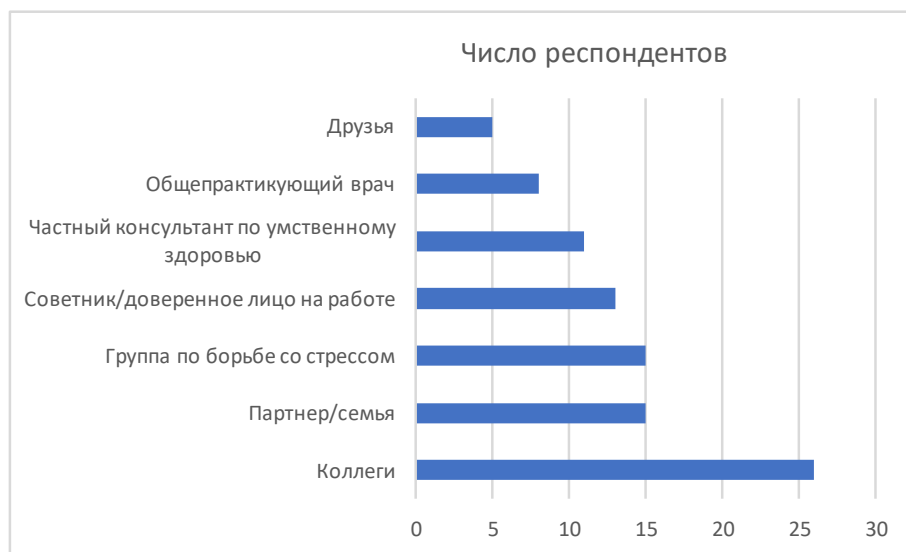
Фигура 2: Источники социальной поддержки в разговоре с другими людьми.

терапевту в нейтральной обстановке снижает опасения по поводу риска навредить своей карьере, проявив уязвимость. С другой стороны, некоторые респонденты чувствовали себя ограниченными в том, чтобы делиться своими историями, потому что их терапевт недостаточно хорошо понимал «язык» полицейского мира. Другой трудностью был поиск терапевта, с которым они были бы связаны, или кого-то достаточно квалифицированного в области травматологии. В-пятых, значительное число респондентов полагались на поддержку, организованную на рабочем месте, чтобы выразить свои эмоции или разочарования: пятнадцать респондентов полагались на стресс-бригаду Федеральной полиции, 53 а тринадцать СП нашли поддержку у психолога или помощника пострадавших в своем отделении. Наконец, пять респондентов указали, что они, как правило, не разговаривали с коллегами или профессиональным консультантом. Они описывали себя как «закаленные» предыдущим травмирующим опытом на работе и считали, что терапия не приносит им пользы. Они предпочли просто «продолжить работу» или разобраться с инцидентом самостоятельно.