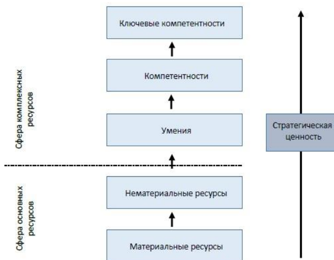
Фигура 1: Создание стратегической ценности в рамках организации.

Согласно Прахаладу и Хамелу, для определенных организаций ключевые компетентности это сферы знаний и опыта, которые состоят из тесно связанных элементов. Для конкурентов сложно скопировать ключевые компетентности поскольку они специфические и характерны для конкретной организации. 16 Сочетание ресурсов и организационных умений уникальным способом формирует ключевые компетентности организации и дает ей преимущество перед конкурирующими преступными организациями, а также перед службами безопасности. 17 Основные ресурсы организации являются фундаментом ее существования. Постоянная координация и