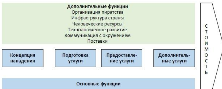
Фигура 2: Система основных и дополнительных функций, участвующих в осуществлении нападения.

Преступные организации являются сбором организаций высокого уровня, которые характеризуются: одержимостью к действию; тесными контактами с клиентами (капитал отношений); автономностью и предприимчивостью; ориентацией на ценности; ограниченным профилем деятельности (структурный капитал); отношением к людям, как к наиболее эффективному ресурсу организации; лидерством; дисциплиной и знаниями (человеческий капитал). 30 Специфический характер морского пиратства позволяет расширить этот перечень включив: мобильность пиратов, способность использовать самые современные технологии, морские традиции и наличие удобных укрытий. 31 Первые два пункта можно классифицировать, как человеческий капитал, последние два, как капитал отношений.