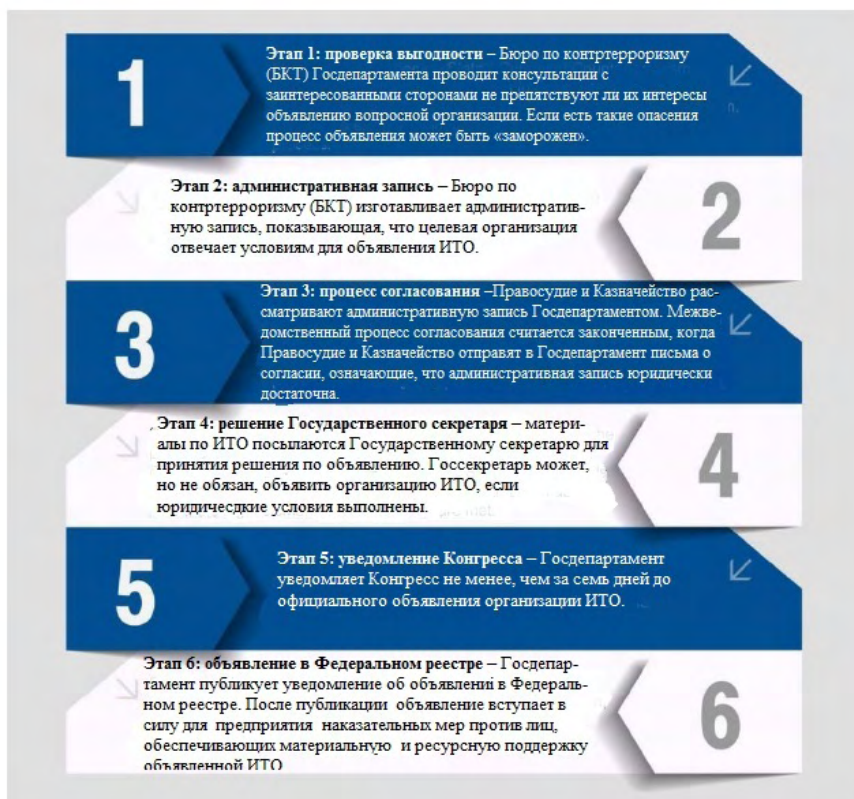
Фигура 2: Шестиэтапная процедура объявления Иностраных Террористических Организаций (ИТО).